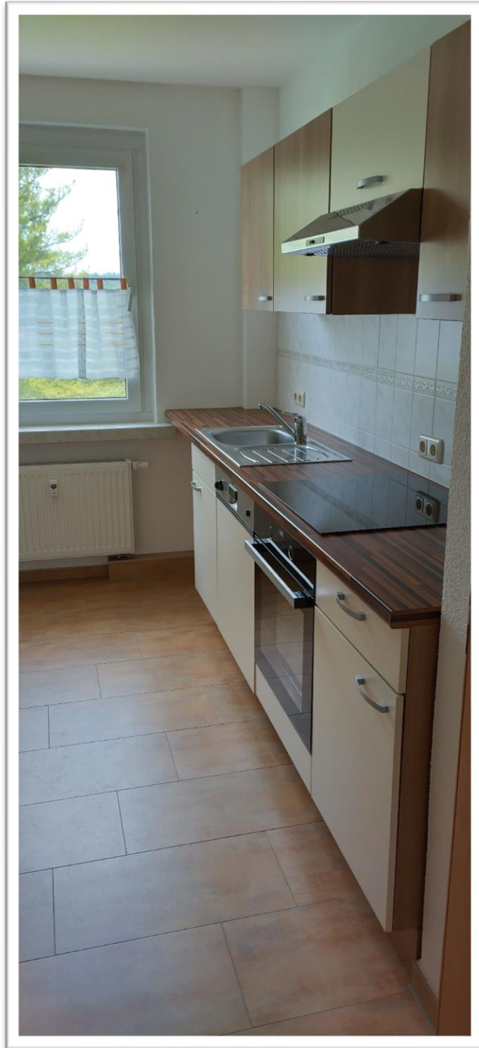
Einbauküche (kann vom Vormieter erworben werden)